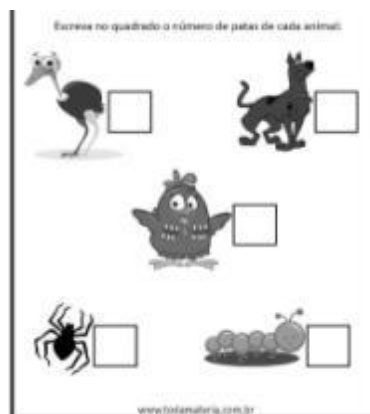
Imagem da atividade.