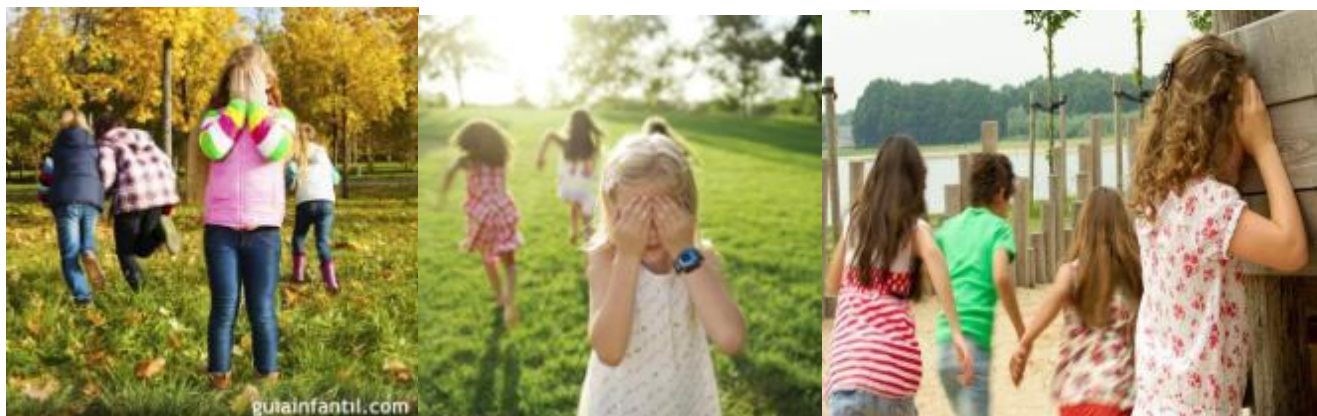
Imagens da atividade.